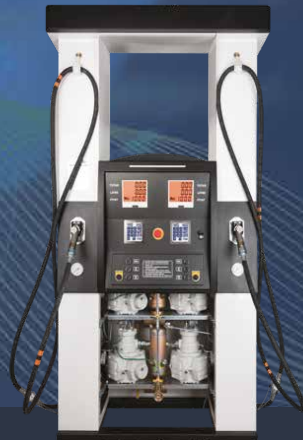
PUNTO STAR 4 - 430