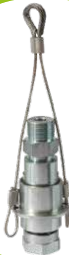
Válvula Break away GLP