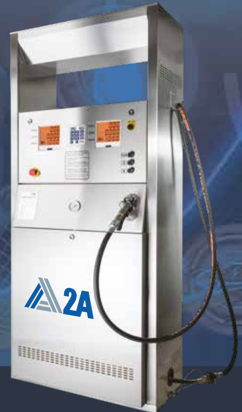
PUNTO ACERO INOXIDABLE