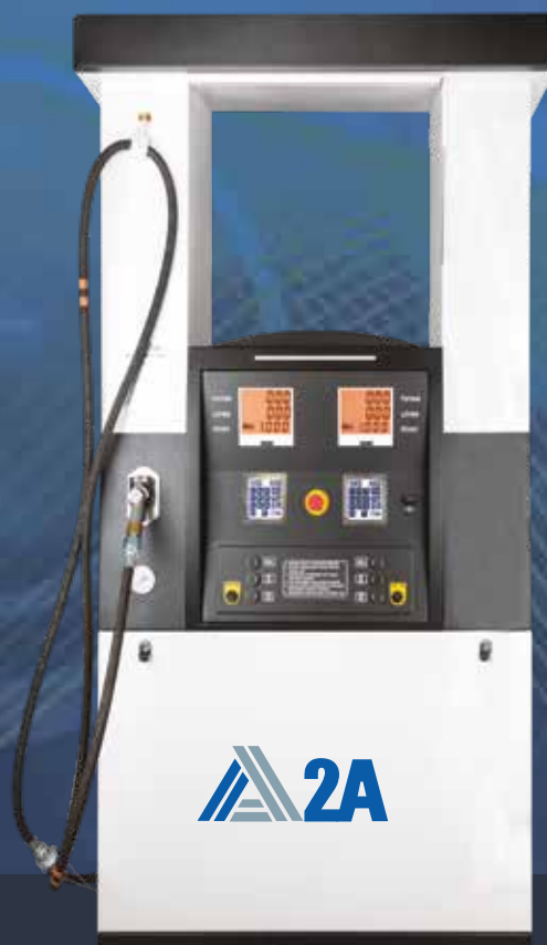
PUNTO STAR 2 - 430