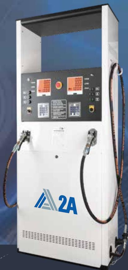
PUNTO ACERO BLACK & WHITE